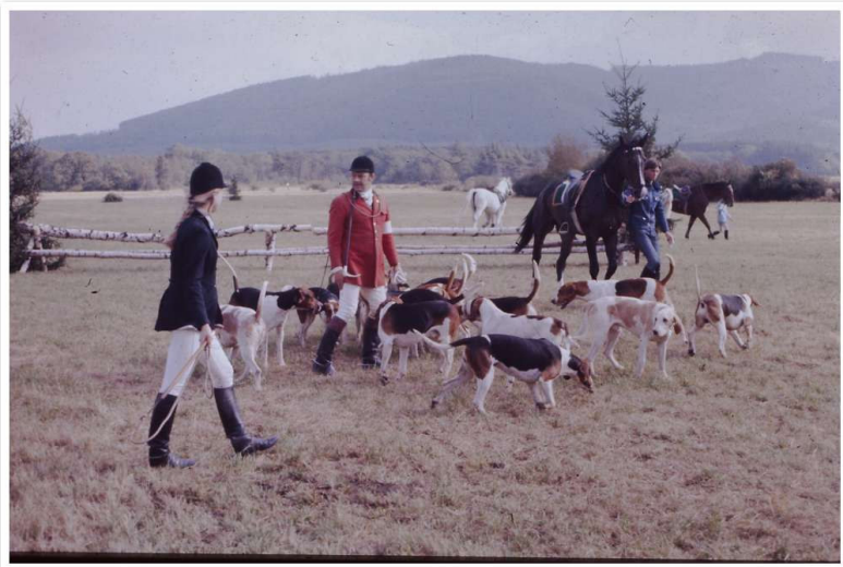
1974 Cappenberger in Westerode

Westerode am Samstag hinter den Foxhounds der Cappenberger-Meute