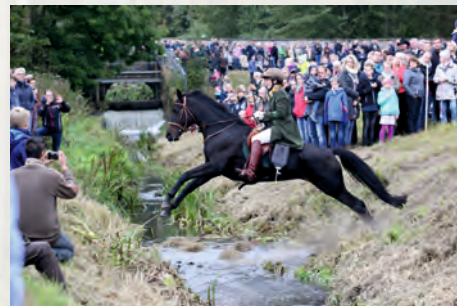
Begleitung durch "Bläsercorps Melle"