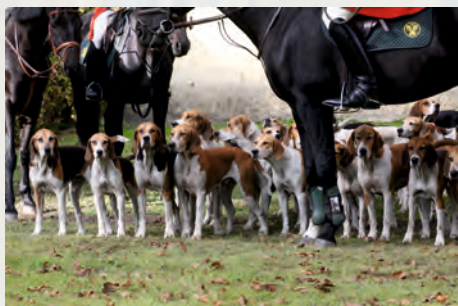
begleitet von der Niedersachsenmeute