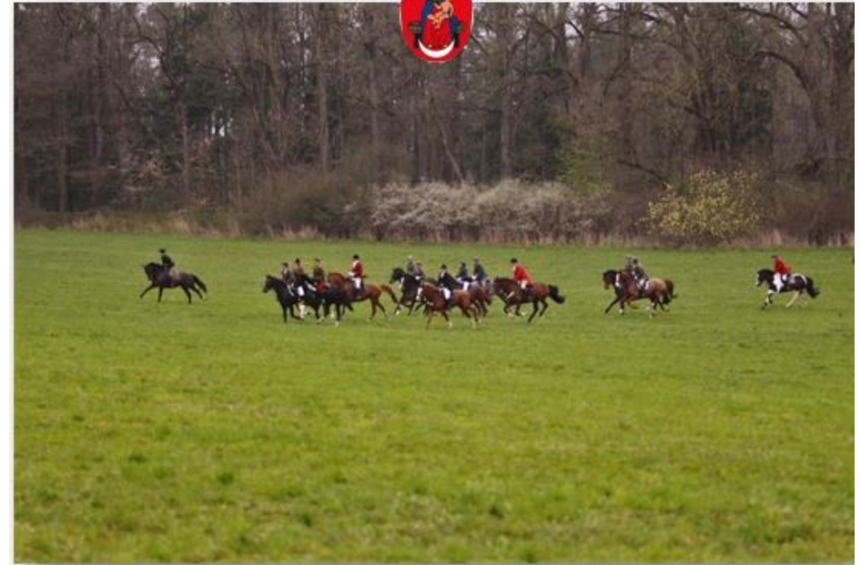
Kratochvíle, April 2016