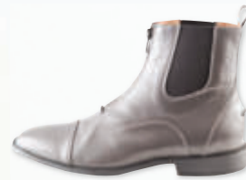
PIIFF Lederstiefelette „Cosmo“ Art.-Nr. 102807 // UVP € 149,95 (Paar)