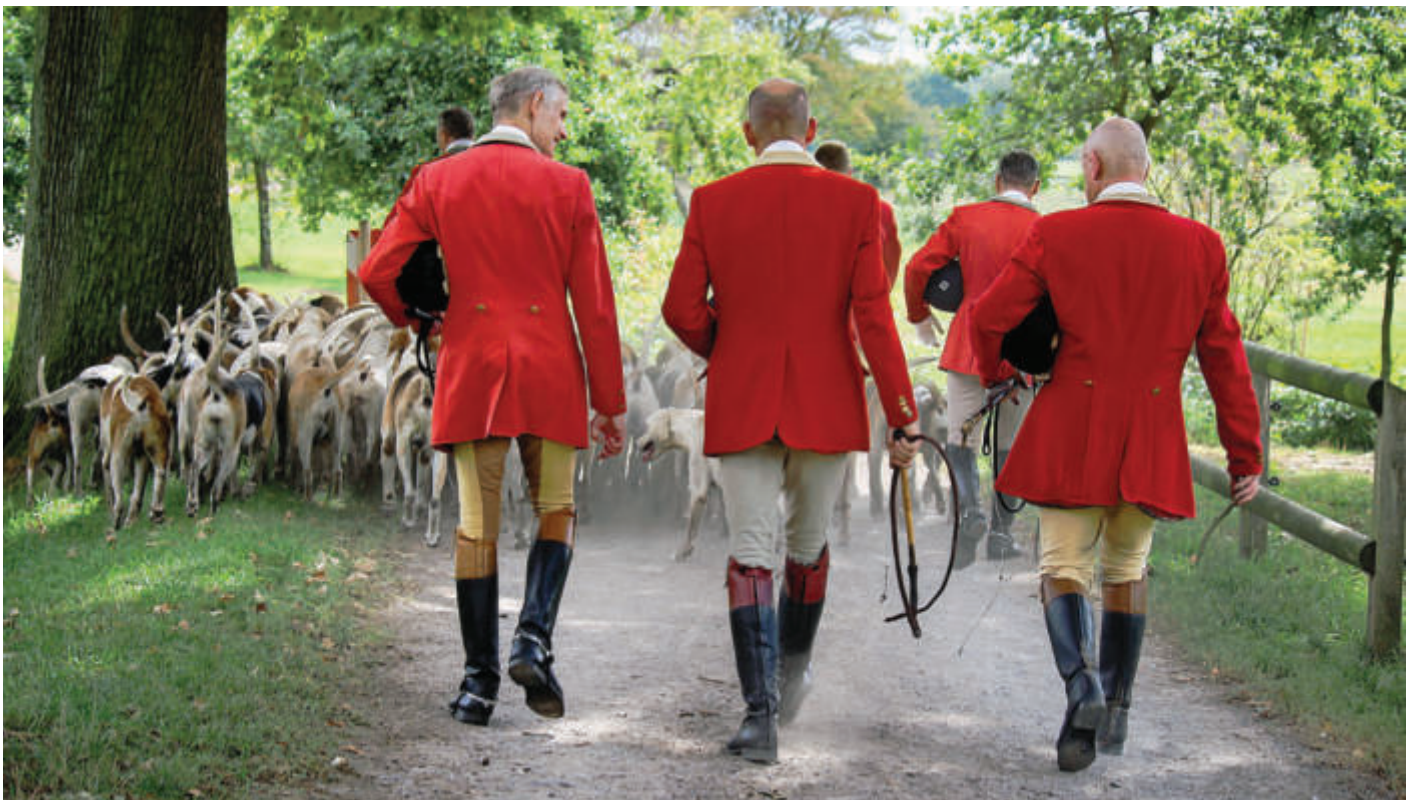
Nach der Jagd versorgt die Equipage die Meute.

Als die Hunde satt und zufrieden sind, werden nun die Jagdteilnehmer mit dem Bruch geehrt. Ein kleiner Zweig aus Eichellaub wird vom Vorstand des Schleppjagdvereins überreicht, den die Reiter sich an ihr Jackett heften. Als sich alle Mitglieder des Schleppvereins im Innenhof versammelt haben, fällt auf, dass die Jagdreiterei anscheinend nicht nur für ältere Semester interessant ist. „In