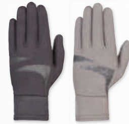
PIIFF Reithandschuh „Glamour“ Winter Art.-Nr. 102818 // UVP € 15,95 (Paar)

Weitere Informationen rund um das Jagdreiten gibt es direkt beim Rheinisch-Westfälischen Schlepjjagdverein unter www.rwsev.de .