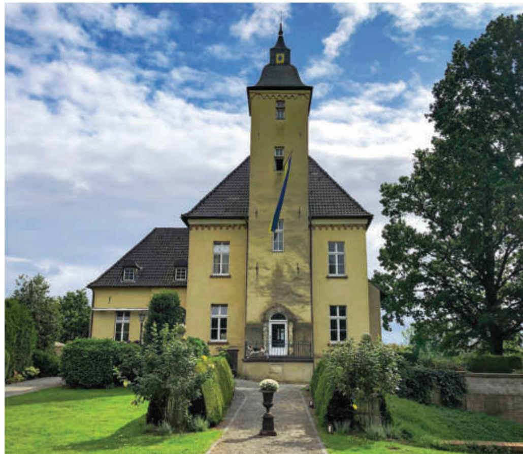
Im 14. Jahrhundert war Haus Schwarzenstein Rittersitz, heute ist es das Zuhause der Schleppjagdreiter.

Leider scheint auch das Wetter der englischen Tradition folgen zu wollen, denn