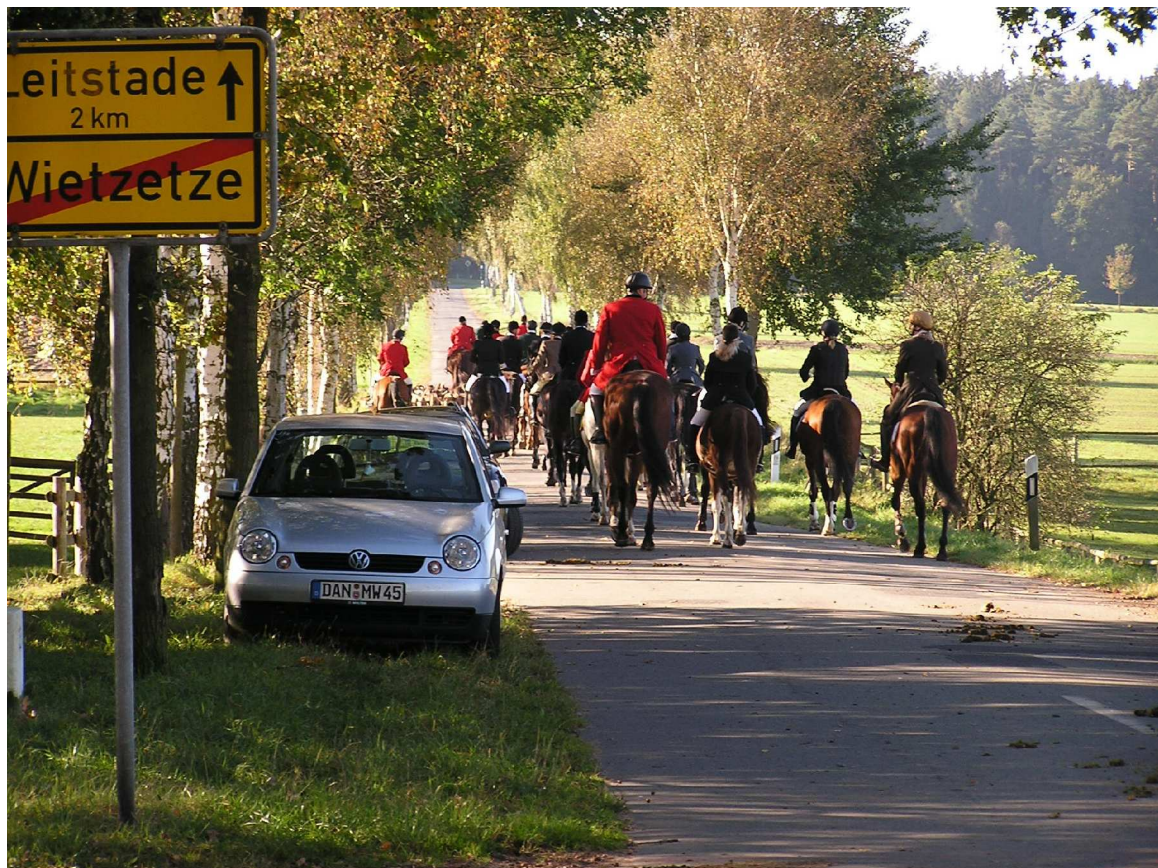
Indian Summer in Wietzetze

www.warendorfer-meute.de Willy Rehr: 0172/ 5332253